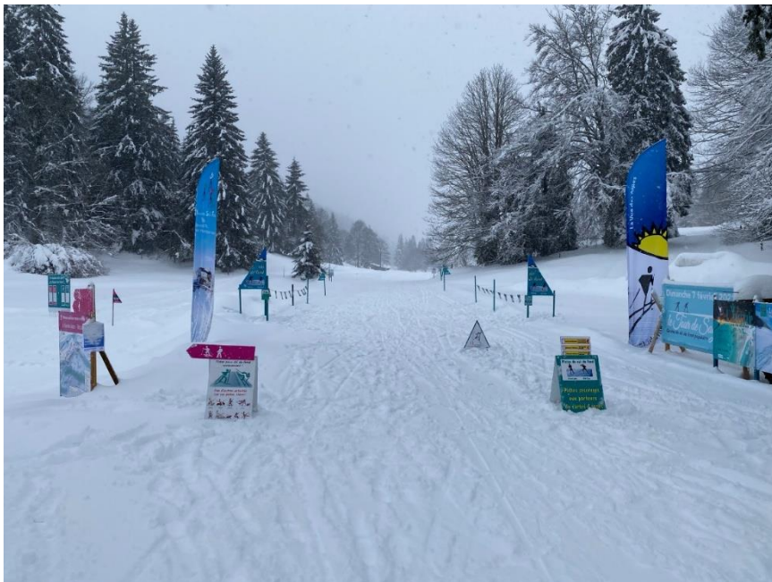
Entrée des pistes, La Vue-des-Alpes, hiver 20/21

Mais, c'est au niveau balisage que réside la plus grande marge de progression et plus spécialement au niveau des entrées de pistes, qui sont souvent communes au ski de fond, aux raquettes et aux marcheurs. Le message est clair, il y a de la place pour chacun de ces sports d'hiver, mais il faut un peu de fair-play pour assurer une saine cohabitation. Pour réduire au maximum les dégradations des pistes, il faut mettre en place un balisage précis et bien visible au départ des pistes. Ce balisage est surtout destiné à informer les nouveaux adeptes d'activités sportives hivernales afin qu'ils adoptent d'entrée les bonnes habitudes.