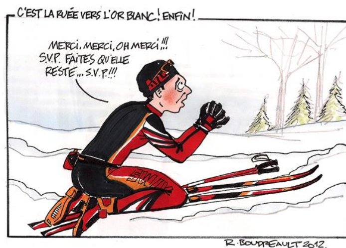
Illustration extraite du journal Les Versants / Québec

Parler de l'hiver 20/21, c'est parler d'un hiver bien enneigé mais c'est également parler du Covid 19 qui a eu de multiples incidences au niveau des activités sportives de loisirs. Les sports d'intérieurs étant interdits, les activités de plein air ont connu un succès sans précédent avec, à la clé, beaucoup de travail pour les Centres nordiques mais aussi des rentrées financières nettement supérieures aux moyennes habituelles. Si historiquement, les Jeux Olympiques de 1968 ont lancé la pratique populaire du ski de fond, on peut dire qu'en 2021 le corona virus a donné un nouvel élan à la pratique du ski de fond. Une vague de nouveaux adeptes a déferlé sur les pistes. Beaucoup ont découvert ou redécouvert le ski de fond. Le bilan a été donc très positif et on peut envisager l'avenir du ski de fond avec sérénité. Il reste à espérer que cette progression se confirme les saisons prochaines.