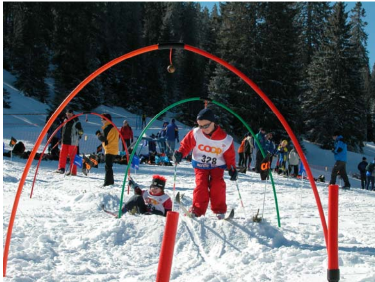
hiver 06 /07