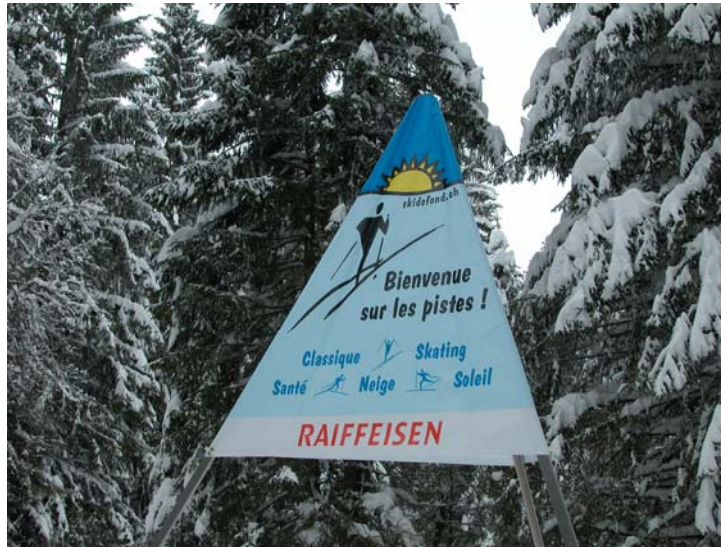
hiver 06 /07