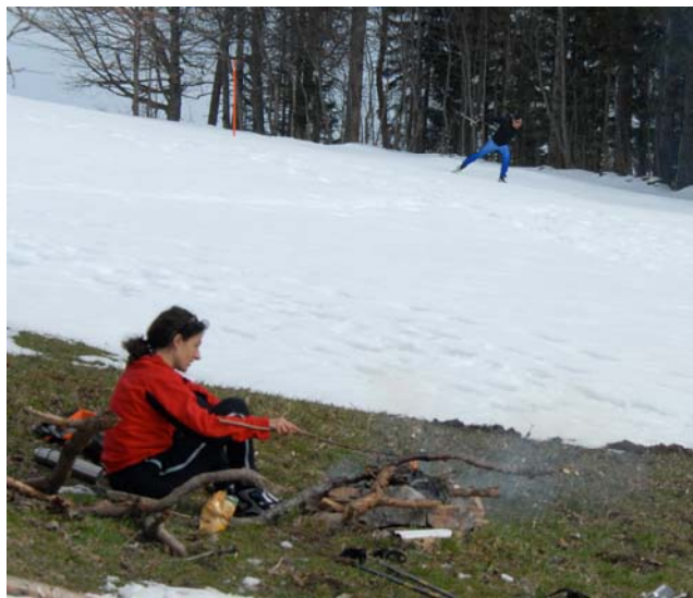
hiver 06/07