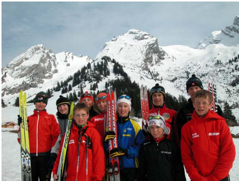
La photo souvenir des jeunes participant(e)s de Suisse Romande !

Romandie Ski de Fond adresse un chaleureux merci à nos amis français qui nous ont fait vivre une magnifique journée