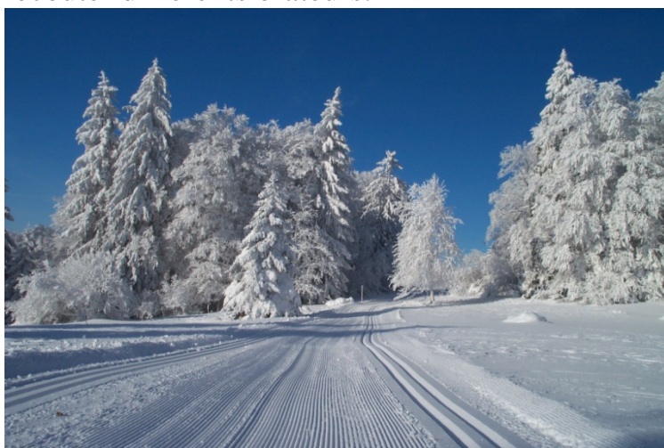
Des pistes de rêve, un défi permanent pour le traceur de piste ! Hiver 07-08

Sous le titre ambitieux, « Tracer des pistes de rêve ! », RSF a proposé une journée de formation pour les traceurs de pistes de ski de fond. Cette journée a connu un grand succès, puisque plus de soixante personnes motivées se sont retrouvées pour écouter différents orateurs.