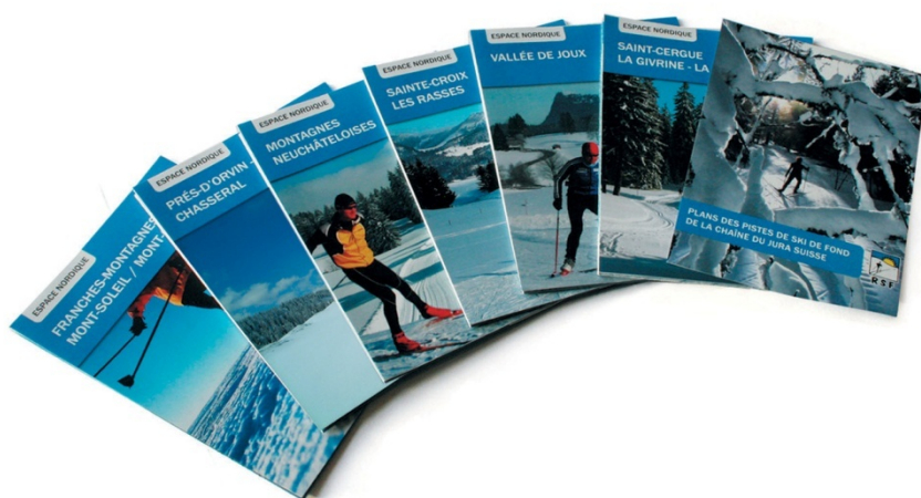
6 cartes et 1000 km de plaisir !

fruit a mûri gentiment, un langage commun s'est mis en place, peu à peu les pictogrammes ont pris la même signification, de St-Cergue à Saignelégier en passant par Le Brassus, Ste-Croix et La Brévine! Cinq ans de travail, pas mal de discussions, pas mal d'énergie dépensée mais les avantages du concept RSF ont fini par émerger. Skieurs et milieux touristiques ont rapidement adopté le produit et reconnu ses qualités. Globalement, le pari est gagné. Reste à y inclure les quelques Centres nordiques manquants et à peaufiner quelques détails pour finaliser le produit. Dans le cadre de cette réalisation, RSF a également développé une nouvelle et intéressante collaboration avec les milieux touristiques de la Chaîne du Jura.