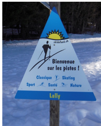
Un panneau du côté de St-George Hiver 08-09

Petit à petit, année après année, Romandie Ski de Fond essaie de façonner une image attractive du ski de fond en terre romande. Une image qui s'inscrit dans la ligne sport, santé, nature. Une image de sport dynamique, qui s'affirme comme prolongement naturel hivernal des activités marche, jogging, nordic walking et VTT ! Une image multi facettes qui englobe aussi bien sport de loisirs que sport de compétition. Concrètement, cela se traduit par la définition d'une ligne commune de développement, par le tissage de liens forts entre les Centres nordiques, par une harmonisation du balisage, par une recherche continue d'amélioration du traçage. En résumé, il s'agit de mettre en valeur et mieux vendre le travail accompli par les Centres nordiques. Nul doute que pour faciliter l'accès au ski de fond, il faut proposer une meilleure visibilité et une communication adéquate.