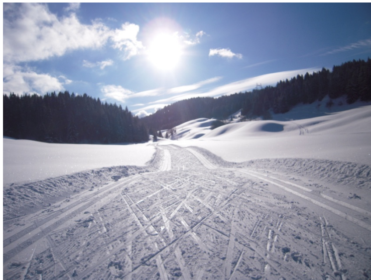
Ski sans frontières, du côté de Bellcombe / Hiver 08-09

RSF teint à remercier tous ses partenaires qui s'engage à ses côtés pour la cause du ski de fond, notamment Loipen Schweiz, Swissski, nos amis de France voisine, les associations Ski Romand, Giron Jurassien des Clubs de Ski et Ski Valais, les sponsors actuels Swisscom, Coop et Raiffeisen ainsi que tous les acteurs de la planète Romandie Ski de Fond qui n'ont pas ménagé leurs efforts pour faire de l'hiver 08-09 un grand millésime.