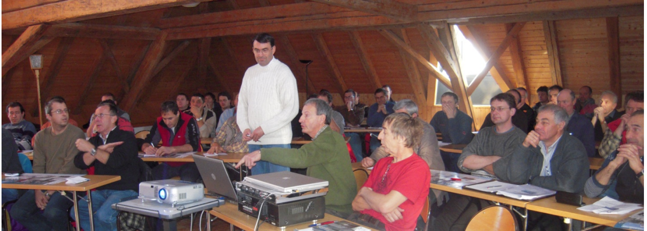
Présentations, échanges d'expériences et bonne humeur ont rythmé cette journée Photo L.Donzé/ Hiver 08-09

Parmi les nombreux thèmes abordés, on peut relever, l'étude de la neige et ses métamorphoses, l'observation des facteurs météorologiques, les bons plans pour prolonger la vie du manteau neigeux et la sensibilisation au damage écologique et économique. La présentation des dernières nouveautés, au niveau des engins de damage, a naturellement captivé l'auditoire et fait rêver plus d'un traceur !